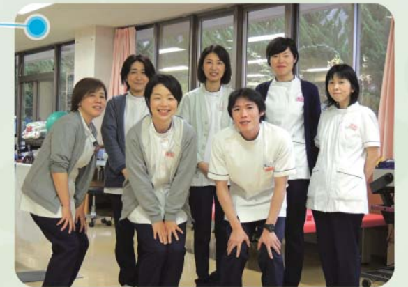
リハビリテーション

明るく、楽しく、時にちよっぴり厳しく、利用者様の機能維持・向上、在宅復帰をサポートします。